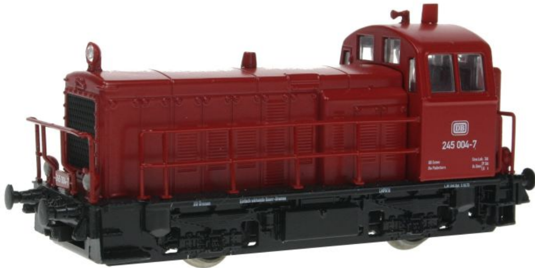
BR 245 Prototyp, DB Epoche IV