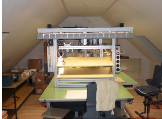
Ansicht Montagebänder, Platz 5